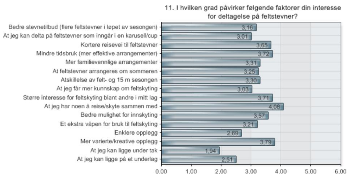
Figur 2: Oversikt over faktorer som påvirker skytternes interesse for deltakelse på feltstevner.

På spørsmålet om hvilke forhold som påvirker interessen for deltakelse på feltsstevner svarte skytterne på en skala fra 1 til 6, hvor 6 henspiller på at faktoren er svært viktig. Gjennomsnittlig score for ulike faktorer fremgår av figur 2 (ref. vedlegg 1).